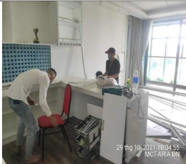
Tháo dỡ đồ rời tại 2 căn hộ mẫu