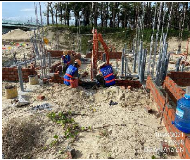
Xây gạch biện pháp dầm tầng 1 căn C, F Villas BT1.2