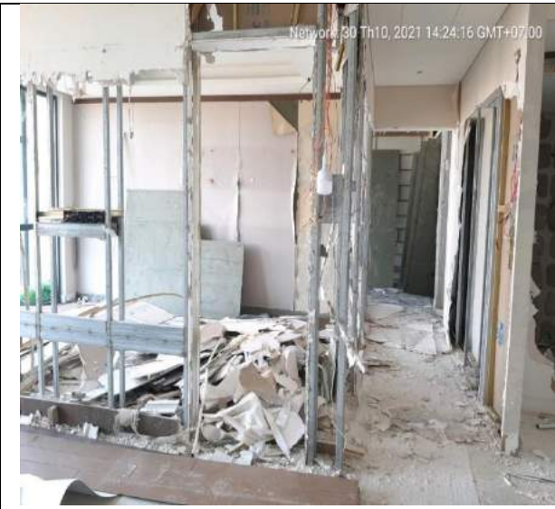
Tháo dỡ tại 2 căn hộ mẫu