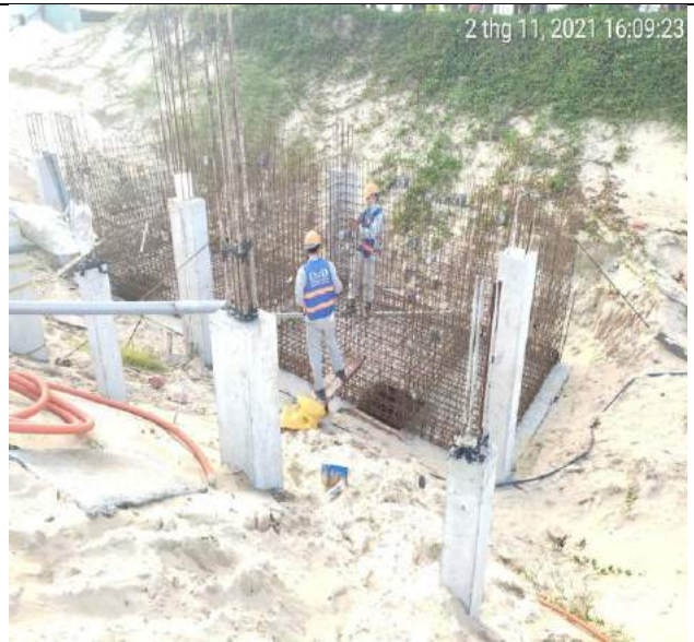
Lắp đặt sleeve MEP bể cân bằng Villas BT1.2 căn C, D