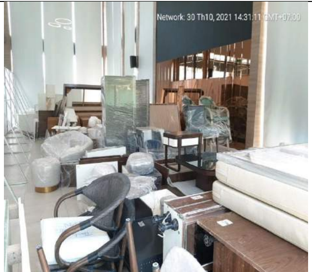
tháo dỡ vật dụng, bàn giao cho đơn vị vận hành