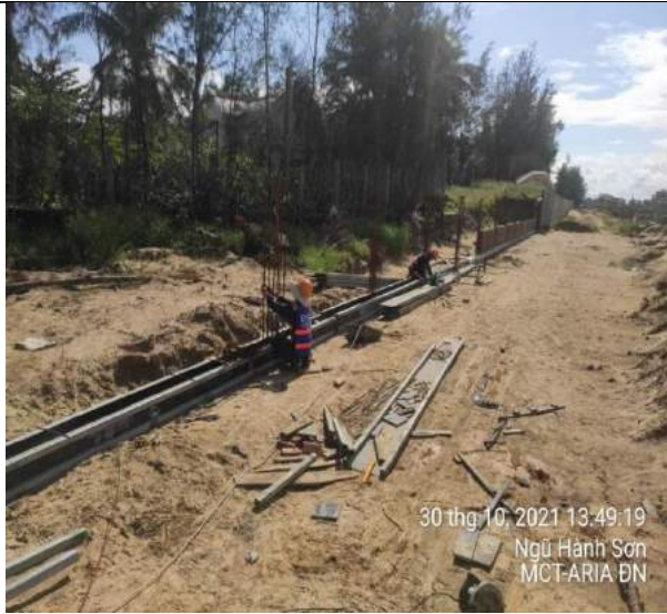
Lắp dựng cốt pha đà kiềng tường chắn PulChra đoạn 1A / trục 8-9