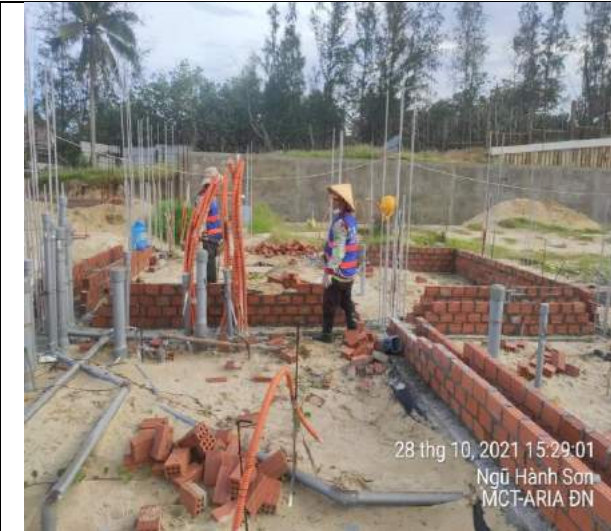
Xây gạch biện pháp dầm tầng 1 căn C, F Villas BT1.2