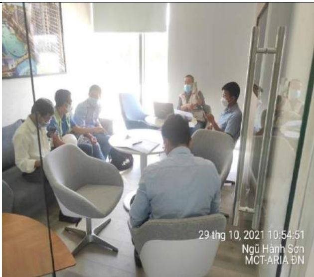
TVQLDA, TVGS, nhà thầu Central họp bàn kế hoạch triển khai thi công