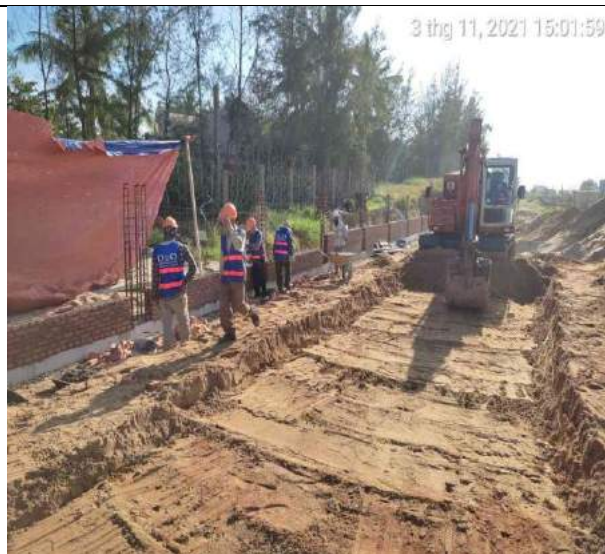
Xây gạch lớp 1 đoạn 1A tường chắn Pulchra