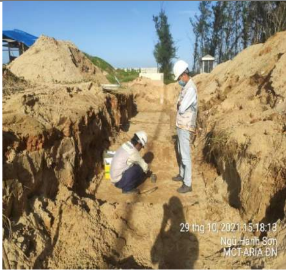
Thí nghiệm kiểm tra độ chặt đất đáy hố móng tường chắn PulChra đoạn 3A trục 9-10