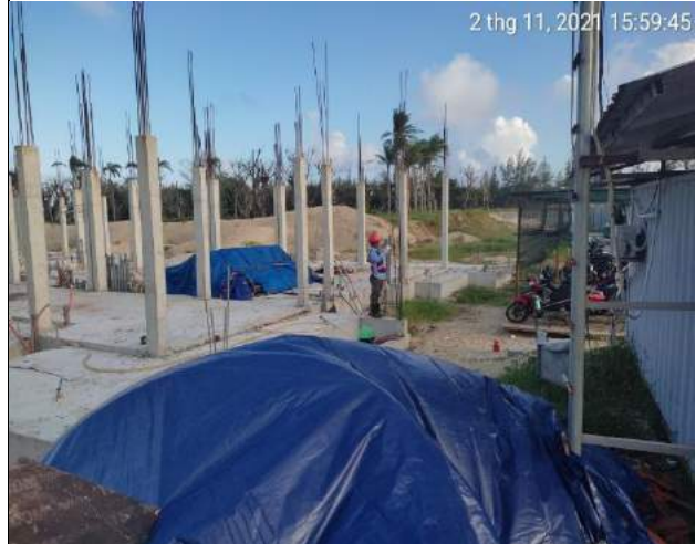
Quét sika monotop chống rỉ thép Villas BT1.1