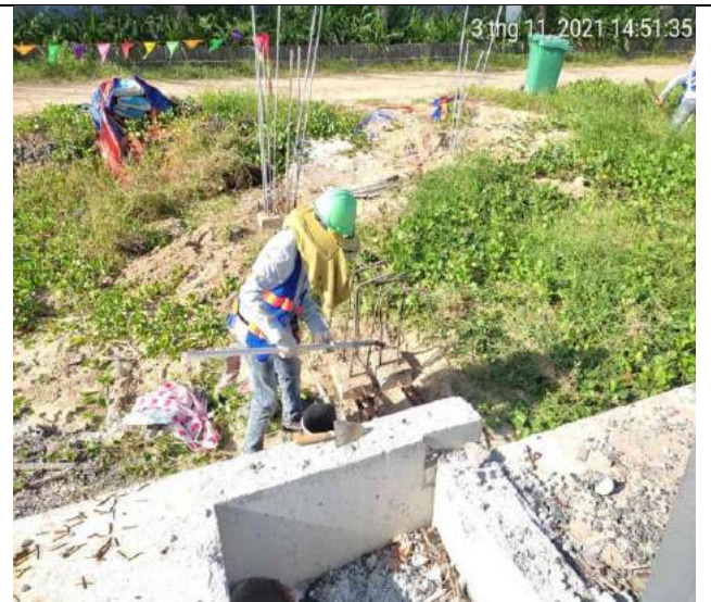
Quét sika monotop chống rỉ thép BT1.1