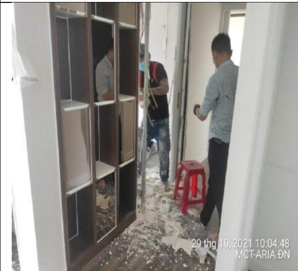
Tháo dỡ đồ rời tại 2 căn hộ mẫu