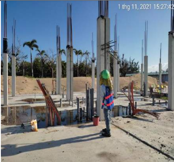
Quét sika monotop chống rỉ thép Villas BT1.1