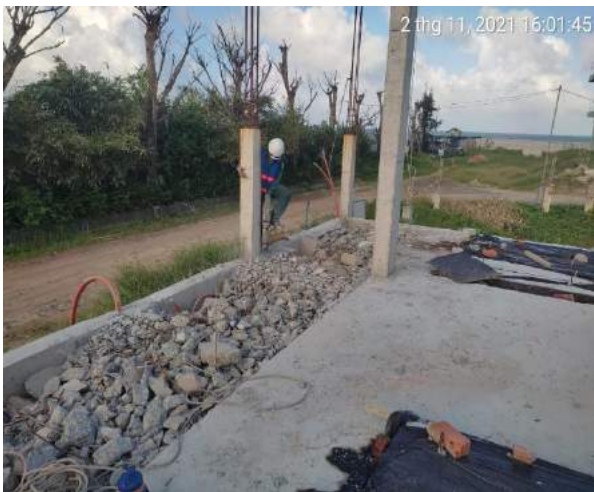
Phá dỡ dầm sàn tầng 1 Villas BT2.1