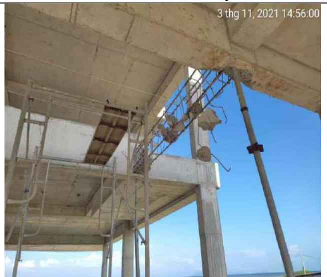
Đục phá bỏ dầm tầng 2 Villas BT3.1/A-B