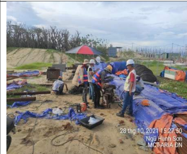
Gia công thép bề cân bằng Villas BT1.2