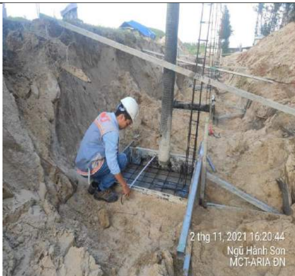
Nghiệm thu lắp đặt cốt thép đáy móng, cổ móng M2 (trục 10h đến 10a)