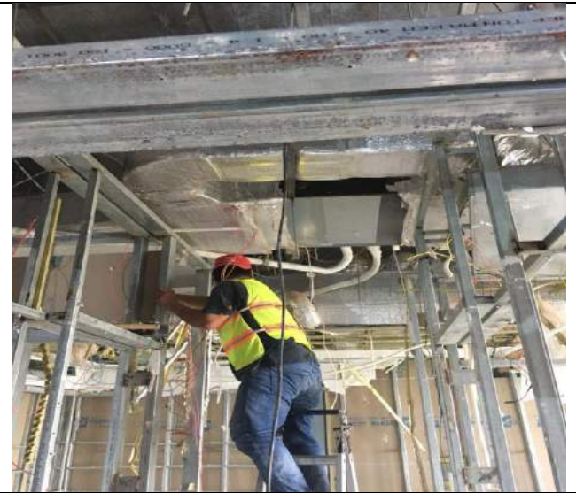
Tháo dỡ tại 2 căn hộ mẫu