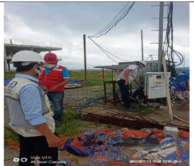
Kiểm tra AT định kỳ