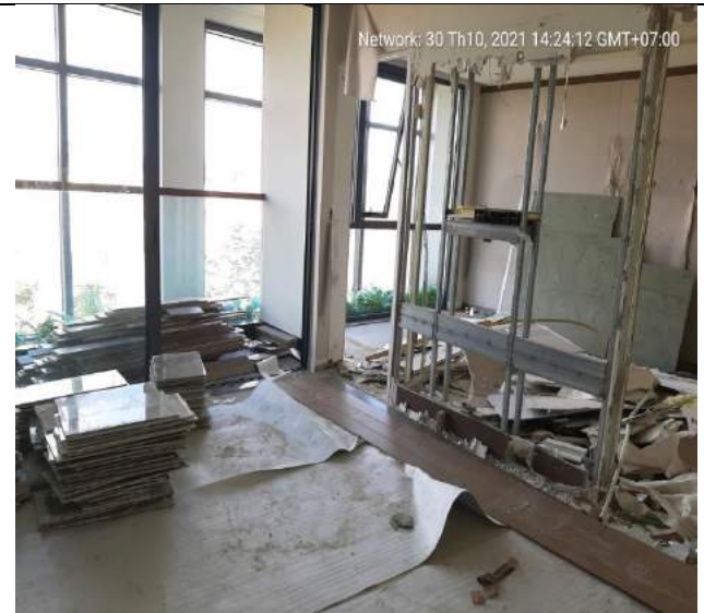
Tháo dỡ tại 2 căn hộ mẫu