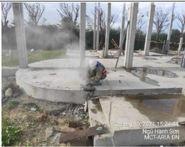
Cắt bê tông, phá dỡ dầm sàn theo thiết kế Villas BT2.1