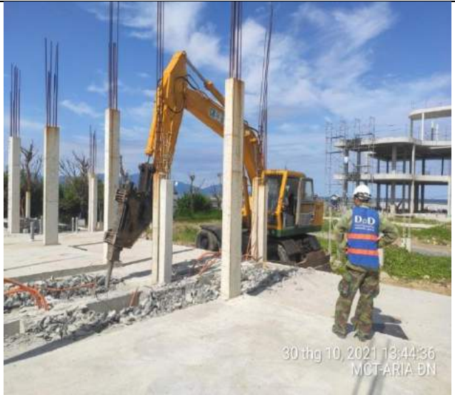
Phá dỡ vị trí dầm sàn thay đổi theo HSTK mới