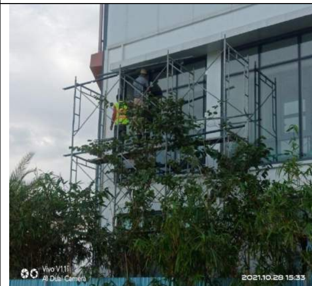
Dựng dàn giáo tháo dỡ vách kính tại căn hộ mẫu