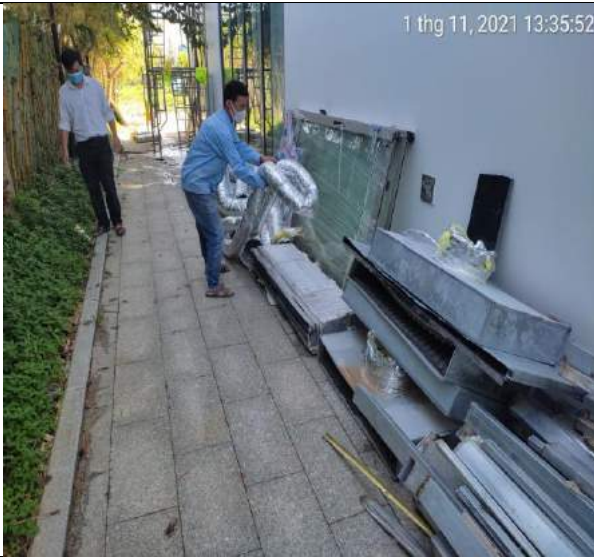
Tháo dỡ tại 2 căn hộ mẫu