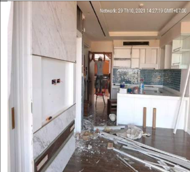
Tháo dỡ đồ rời tại 2 căn hộ mẫu