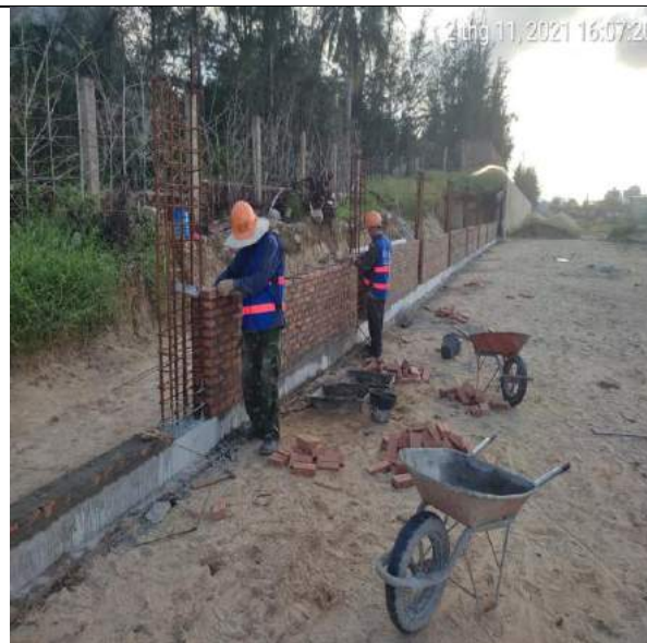
Xây gạch lớp 1 đoạn 1A tường chắn Pulchra