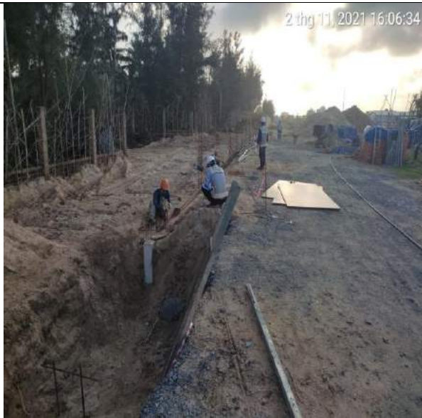
GCLD thép, cốp pha cổ móng đoạn 3A