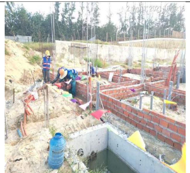
Xây gạch làm ván khuôn dầm tầng 1 Villas BT1.2 căn C, D