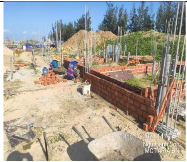
Xây gạch làm ván khuôn dầm tầng 1 BT1.2 căn C, D