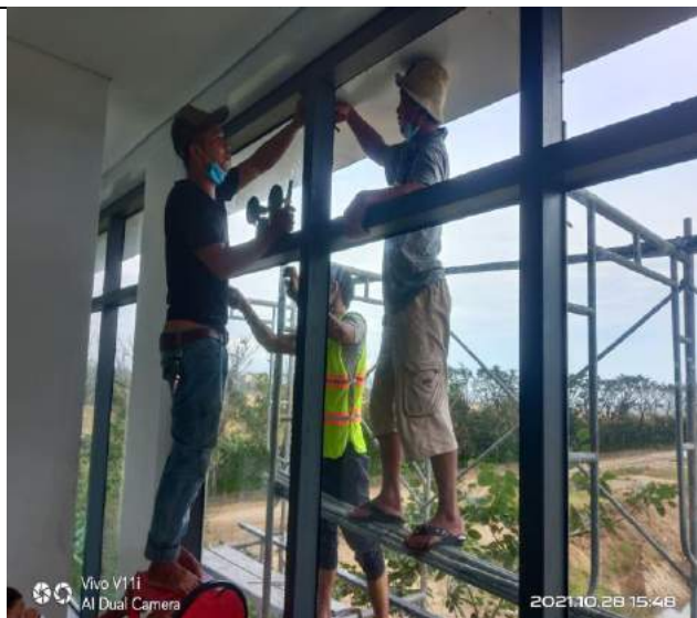
Tháo dỡ Kính làm lối đi tạm thi công