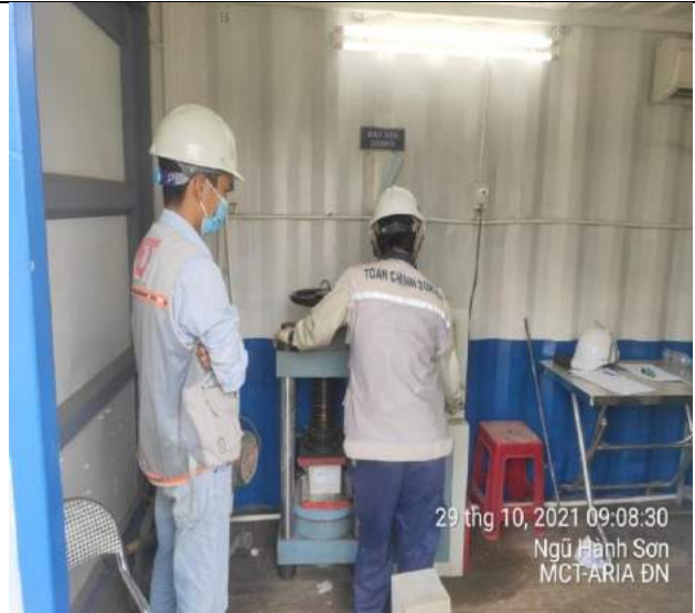
Thí nghiệm nén mẫu bê tông tường chắn PulChra đoạn 1A trục 8-9