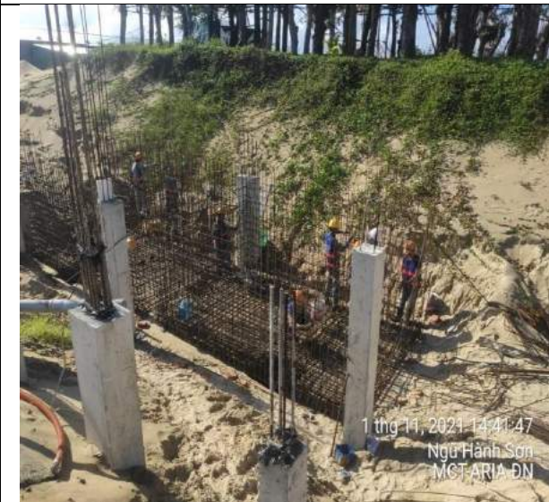
Lắp dựng thép bê cân bằng Villas BT1.2 căn C, D