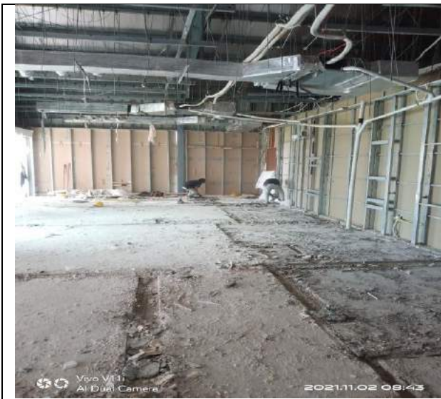
Đục nền, tháo dỡ tại 2 căn hộ mẫu