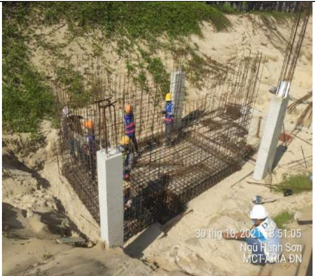
Lắp dựng thép bể cân bằng biệt thự BT1.2 căn C, D