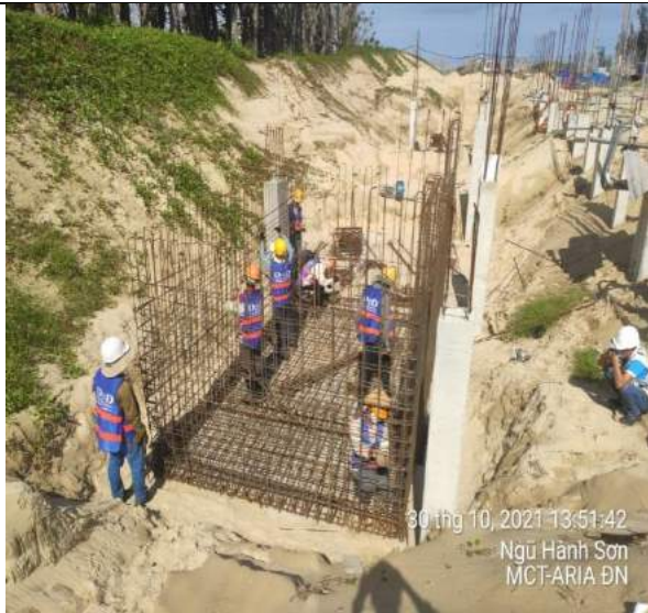
Lắp dựng thép bể cân bằng biệt thự BT1.2 căn C, D