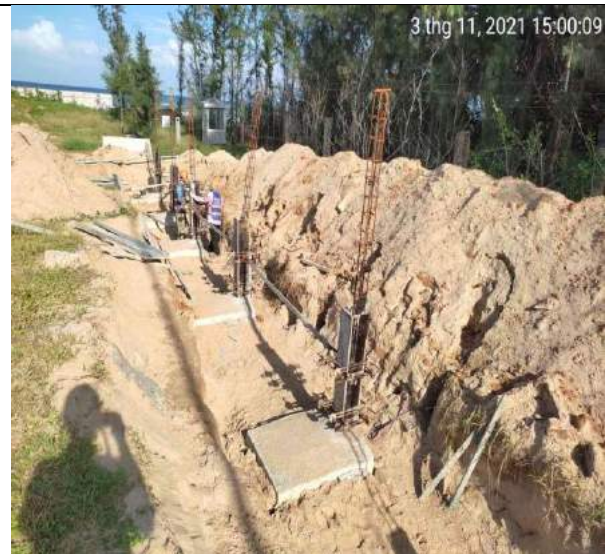
GCLD thép, cốp pha cột móng đoạn 3A