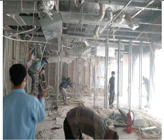
Tháo dỡ tại 2 căn hộ mẫu